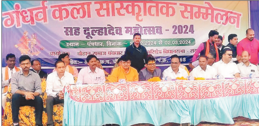
सामूहिक विवाह आयोजन में आशीर्वाद देने पहुंचे केबिनेट मंत्री ओपी चौधरी।